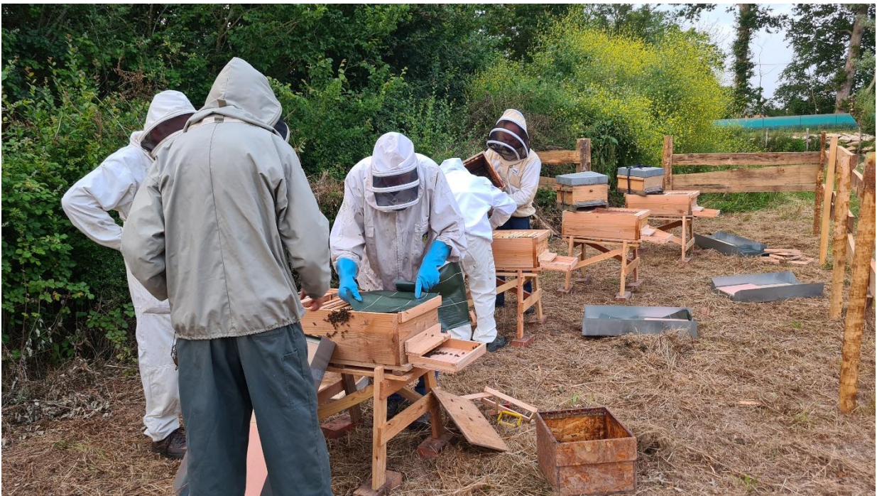
Installation du rucher de Goustranville