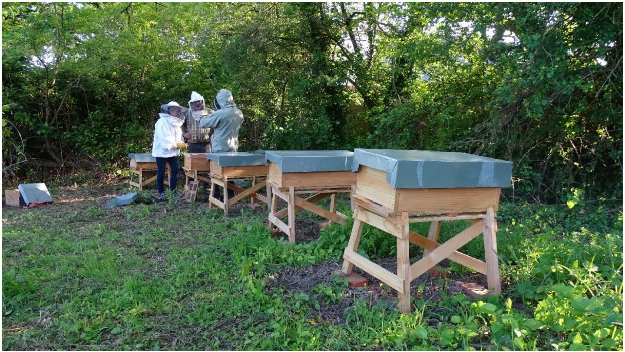
Installation du rucher de Gerrots